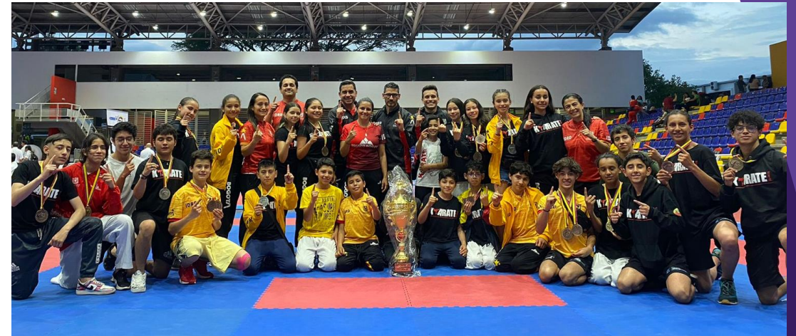
PROGRAMAS TECNIFICACIÓN, TALENTO Y RESERVA 2023