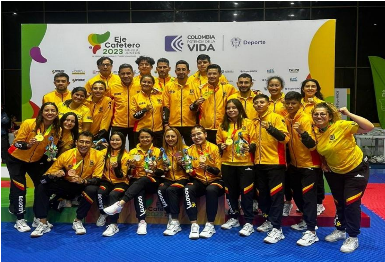
JUEGOS DEPORTIVOS NACIONALES NOV. 2023